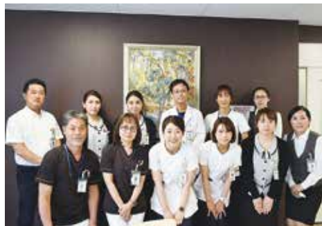
スタッフ一同お待ち申し上げます

★回線が混み合うことがございます。その場合、恐れ入りますが、お時間を 変えてお掛け直し下さい。