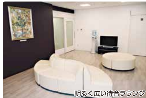
明るく広い待合ラウンジ