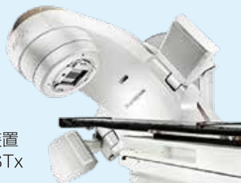
図：放射線治療装置 TrueBeamSTx

IMRTは腫瘍の近くに正常組織が隣接している場合でも正常組織を守りながら腫瘍に多くの放射線を当てる事が可能ながん治療で様々なタイプのがんに適応できます。